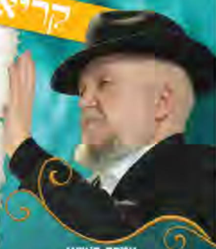
עשרת ראשון מרן פאר הדור רבנו מאיר מאוזן שליט"א

רכב שברולט 2019 או תמורתו במזומן תכשיטי זהב ויהלומים ועוד פרסים יקרי ערך